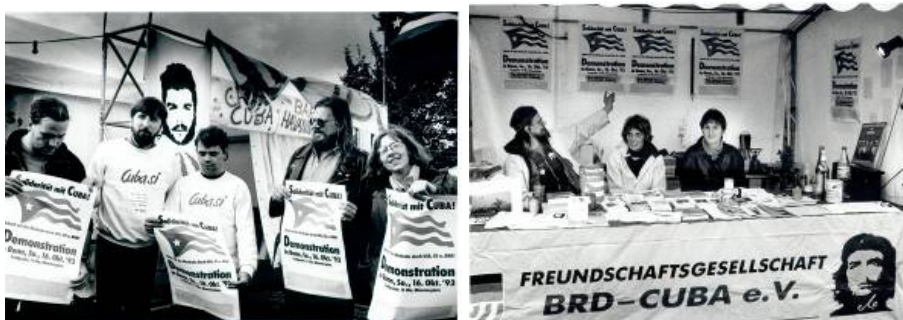
UZ-Pressesfest, 24. – 26.09.1993, Bottrop

Wenn auch in diesen Anfangsjahren die Organisierung der materiellen Solidarität absolute Priorität hatte, wurde doch nie die ebenfalls notwendige politische Solidarität ausgeblendet. So war die deutsche Bundesregierung immer wieder Adressat von Forderungskatalogen des NETZWERK CUBA bzw. einzelner Gruppen. Am 16. Oktober wurde eine bundesweite Solidaritätsdemonstration » Schluß mit der Blockade durch USA, EG und BRD! « durchgeführt