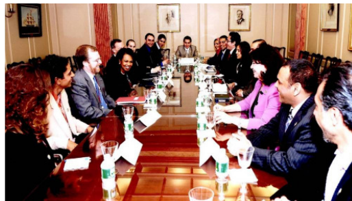
Condoleezza Rice mit den Gästen von Freedom House