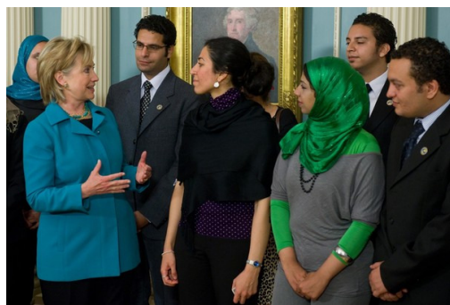
Außenministerin Hillary Clinton spricht mit ägyptischen Aktivisten zur Beförderung von Freiheit und Demokratie, eingeladen von Freedom House, am 28. Mai 2009.

Dies waren Treffen auf hoher Ebene. Diese Oppositions-Gruppen, die eine wichtige Rolle in der Protesbewegung spielen, werden missbraucht, um den US-Interessen zu dienen. Amerika wird als Modell von Freiheit und Gerechtigkeit dargestellt. Die Einladung von Dissidenten im Außenministerium und Kongress bezweckt, ein Gefühl von Engagement und Loyalität für amerikanische demokratische Werte einzuimpfen.