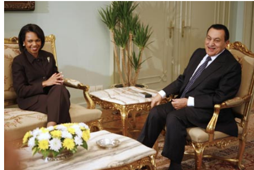
Condoleezza Rice plaudert mit Hosni Mubarak - „Hoffnung für die Zukunft Ägyptens“?