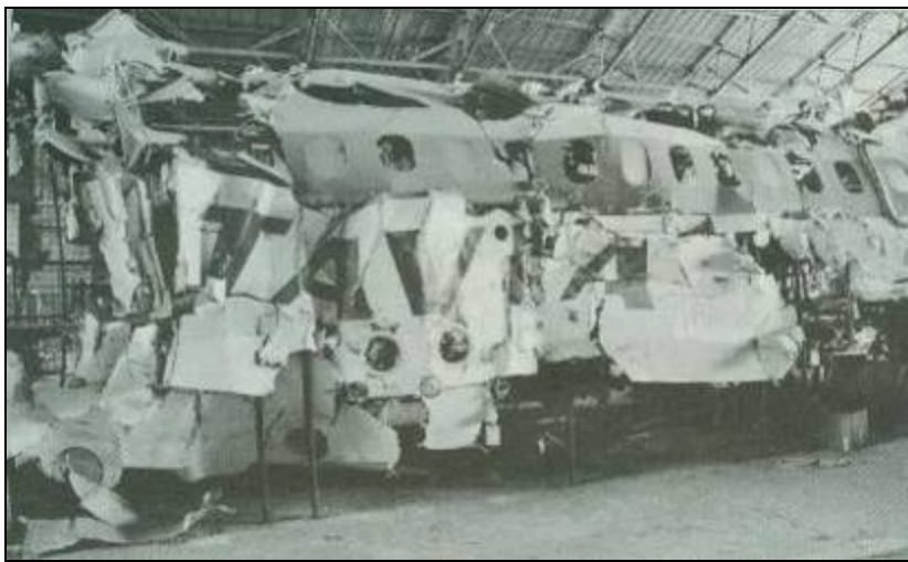
Zur Untersuchung der Absturzursache wurden die Flugzeugtrümmer wieder zusammengesetzt

In einer von den Geheimdiensten inszenierten Desinformationskampagne wurde das Märchen von der Bombenexplosion jahrelang verbreitet. Der Standpunkt der Itavia wurde bestätigt, als 1987 endlich das in 3 000 Meter Tiefe liegende Wrack der DC 9 gehoben wurde. Im Inneren der Maschine waren keine Spuren von Flammen zu erkennen, was eine Bombenexplosion ausschloss. Einen Raketeneinschlag bestätigte dagegen, dass eines der beiden Triebwerke völlig geschmolzen und im Frachtraum Einschläge zu erkennen waren. Bezeichnenderweise fand die französische Bergungsgesellschaft IFREMIR den Voice-Recorder, der die letzten Meldungen des Piloten aufgezeichnet haben musste, angeblich nicht. Das Unternehmen, das bereits mit den Amerikanern Teile der 1912 gesunkenen Titanic geborgen hatte, wurde beschuldigt, den Fund unterschlagen zu haben.