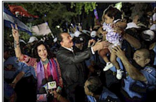
Ortega erhielt zahlreiche Bezeugungen der Freude von Seiten der Nicaraguaner

Inmitten des Jubels des Volkes bezog sich Ortega in seiner ersten Ansprache, nachdem der Oberste Wahlrat ihn offiziell zum Gewinner der Präsidentschaftswahlen erklärt hatte, auf Fortschritt, Wohlstand, Gesundheit, Bildung, Sport, sowie auf die Kontrolle der Kriminalität des mittelamerikanischen Landes als die Stützpfeiler, die es zu verteidigen und zu erkämpfen gilt, um die Gesellschaft zu errichten, die sein Volk und seine Regierung anstreben.