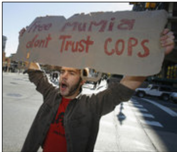
»Befreit Mumia! Vertraut den Bullen nicht!« – Aktivist vor dem Bundesgericht in Philadelphia (Pennsylvania, USA, 9. November 2011)

Viele verurteilte Mörder werden in den USA nach Verbüßung von weitaus weniger als dreißig Haftjahren entlassen. Deshalb wäre es an diesem Punkt angemessen, wenn der Bezirksstaatsanwalt anerkennen würde, daß dieser spezielle Gefangene nicht nur genug gelitten hat, sondern weitaus mehr, als es die Verfassung zuläßt; und er sollte als Staatsanwalt das Gericht bitten, Abu-Jamal nach Verbüßung dieser langen Haft jetzt umgehend freizulassen.