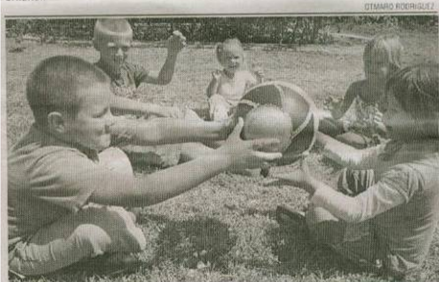
Tarárá ist die Stadt aller, meinen diese kleinen Ukrainer, die Glück ausstrahlen, während sie im Freien spielen