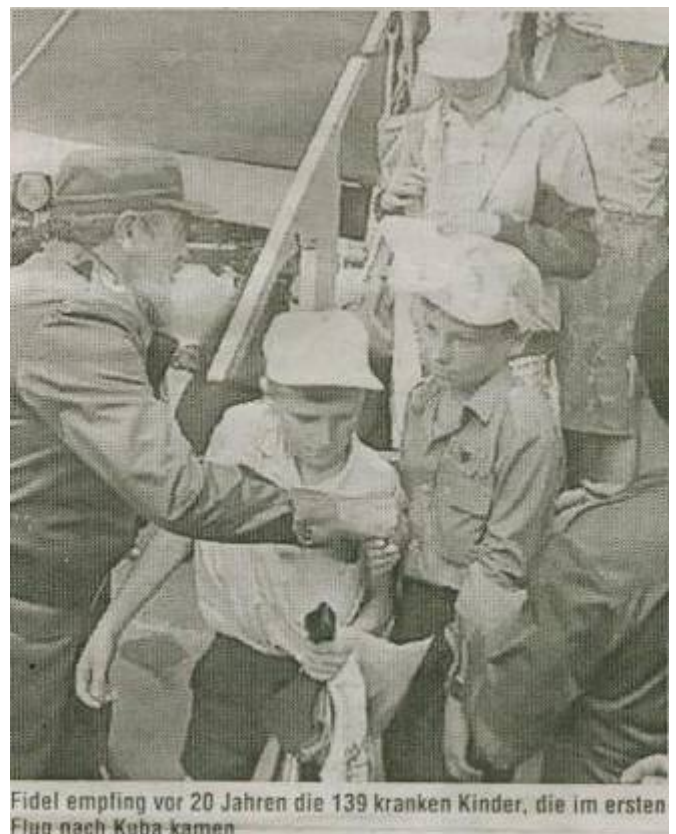
Fidel empfing vor 20 Jahren die 139 kranken Kinder, die im ersten Flug nach Kuba kamen

In der Ukraine arbeitet ein kubanisches Ärzteteam, das die Aufgabe hat, die Patienten zur Behandlung auf der Insel auszuwählen.