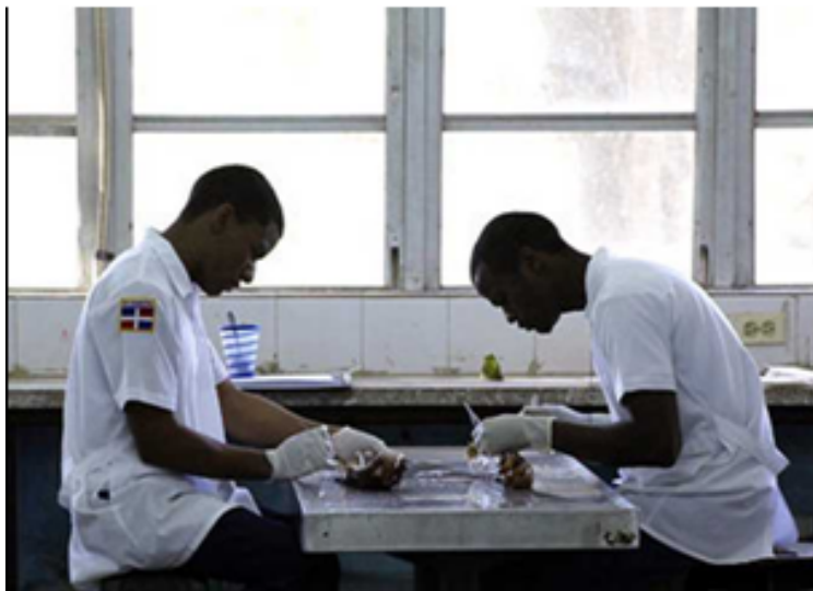
Lernen, um zu helfen: Tausende Studierende aus 28 Ländern bereiten sich in Havanna darauf vor, in ihren Heimatländern als Ärztinnen und Ärzte arbeiten zu können

Mit einer ehemaligen Marineakademie in Playa am Rande der Hauptstadt stellte das kubanische Verteidigungsministerium die ideale Anlage zur Verfügung. Neben Jugendlichen aus Lateinamerika und der Karibik studieren hier heute angehende Ärzte aus Afrika, Asien, Ozeanien, dem Nahen Osten und aus den USA. Das insgesamt sechs Jahre dauernde Studium ist für sie kostenlos, Kuba stellt Unterkunft, Verpflegung, persönliche Hygieneartikel und das gesamte Lehrmaterial. Außerdem erhalten die Studierenden ein Taschengeld von 100 Pesos. Die Idee des Comandante ist Wirklichkeit geworden.